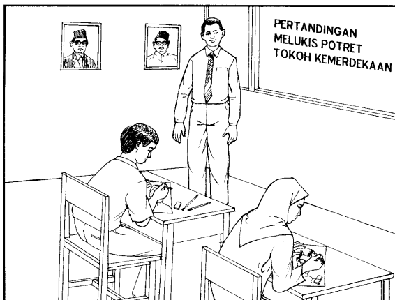
Pertandingan Melukis Potret